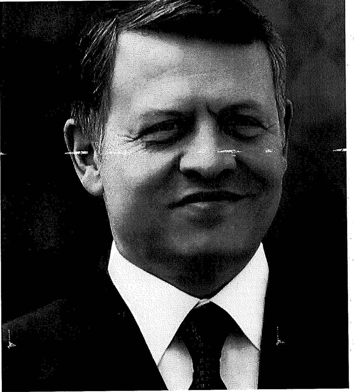
حضرة صاحب الجلالة الهاشمية الملك عبدالله الثاني بن الحسين المعظم