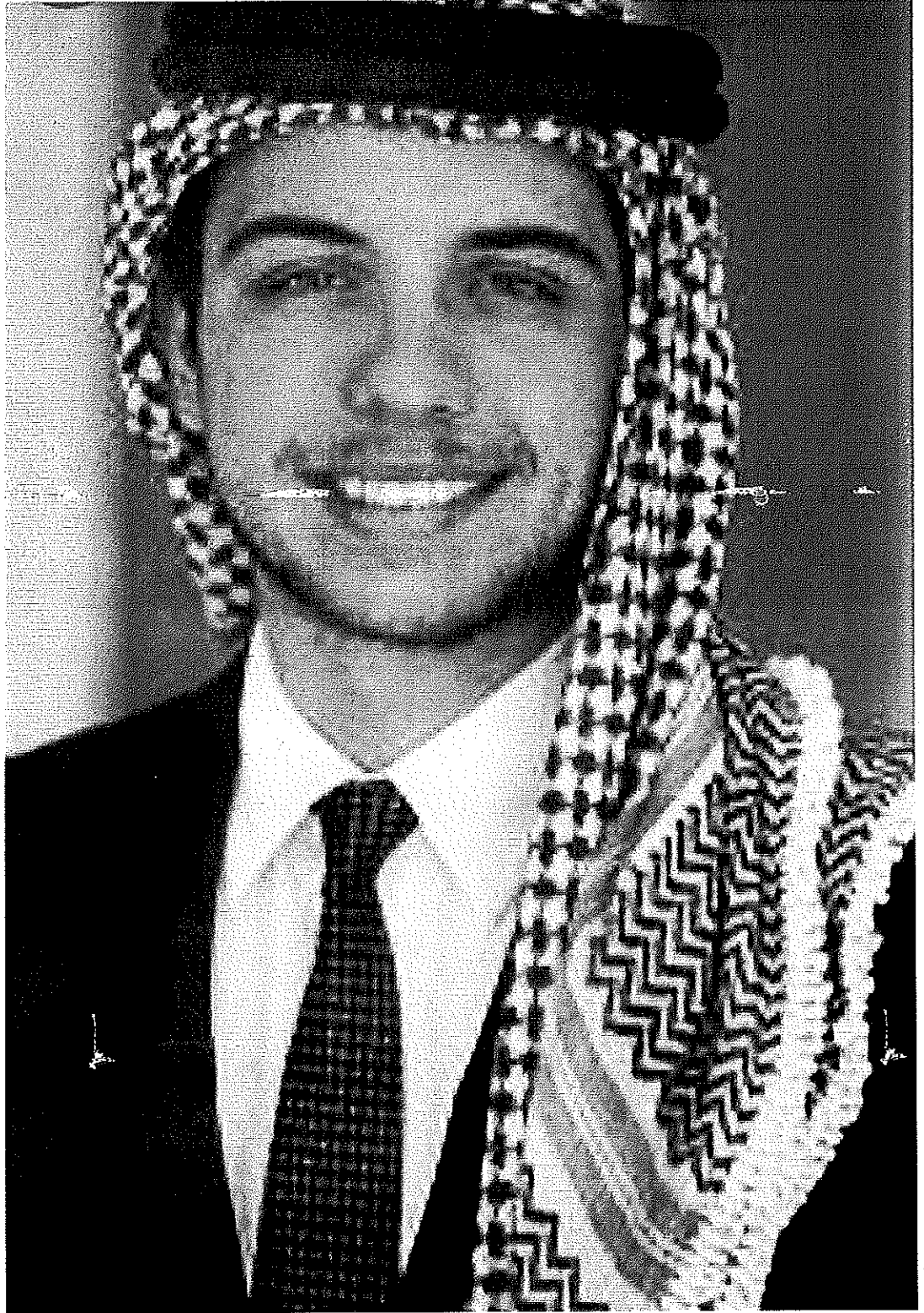
حضرة صاحب السمو الملكي ولي العهد الأمير الحسين بن عبدالله الثاني المعظم